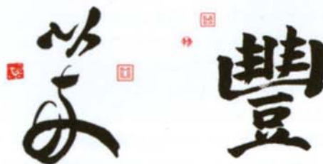
Links: das chinesische Zeichen für „Teamwork“; rechts: das einprägsame Symbol für „Erfolg“.

Die Feng-Shui Lehre besagt, dass Chaos am Arbeitsplatz die Arbeitszeit verlän-