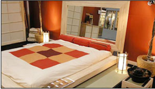
Ein Leben in Harmonie mit der Umgebung verspricht die alte Lehre des Feng-Shui.

Alles um uns herum ist Energie, wir müssen sie nur zum Fließen bringen. Feng-Shui Experte Günther Sator gibt Einblicke in die uralte chinesische Harmonielehre.