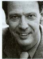
Günther Sator, Österreichs bekanntester Feng-Shui- Experte.

Besonders wichtig ist im Feng-Shui die Partnerecke des Schlafzimmers. Um Ihre Liebesbeziehung positiv zu beeinflussen, sollten Sie sich diese Raumzone genauer ansehen. Sie liegt vom Eingang aus gesehen rechts hinten im Raum. Wie sieht es dort aus? Liegt die Bügelwäsche dort? Oder steht hier ein Schrank, den Sie schon längst loswerden wollen? Gestalten Sie die Partnerecke mit besonderer Sorgfalt. „Schaffen Sie hier einen Platz der persönlichen Art, in den Sie symbolisch jene Qualitäten bringen, die für Sie eine gelungene Partnerschaft beschreiben.“ Mit gutem Licht zum Beispiel, gut gedeihenden, blühenden Pflanzen oder persönlichen Gegenständen, die für Sie Gemeinsamkeit darstellen. Wie Yin und Yang beim Spiel. □